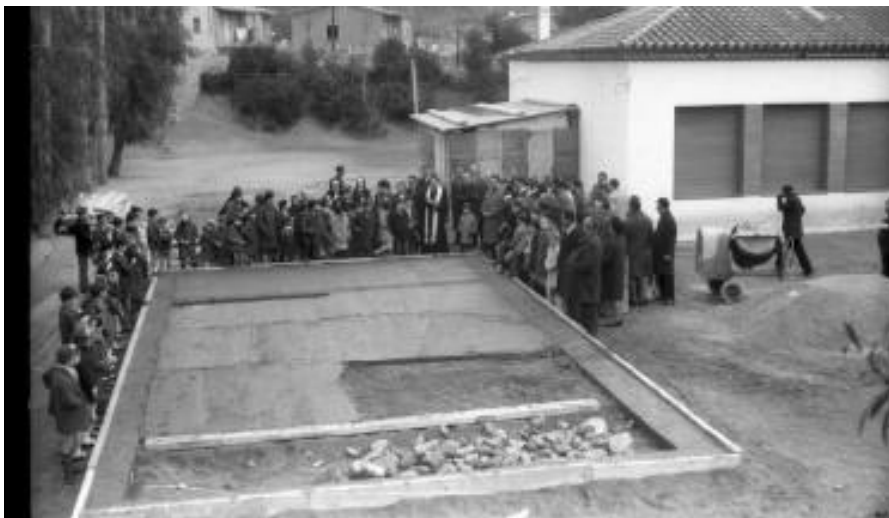
Any 1968 *. Col·locació de la primera pedra de l'ampliació de dues aules