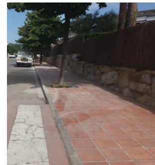
Imatges de les etapes de reparació de les voreres de l'Ametllareda